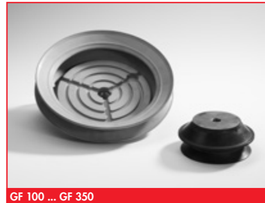
GF 100 ... GF 350