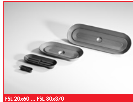
FSL 20x60 ... FSL 80x370