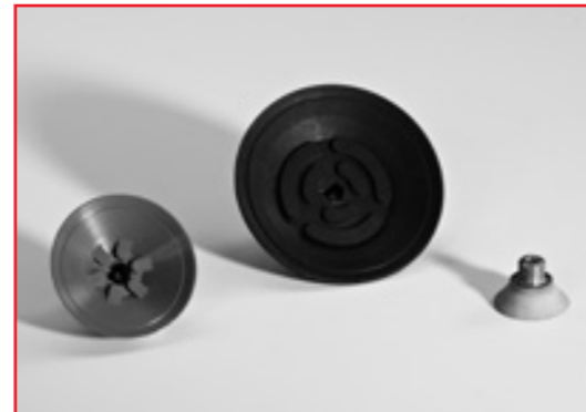
FS-GG 30 ... FS-GG 80